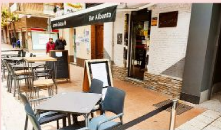
Café & Copas Albanta Av. Segovia 89